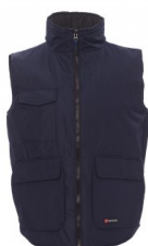
AZUL MARINO DE VESTIR/AZUL REAL